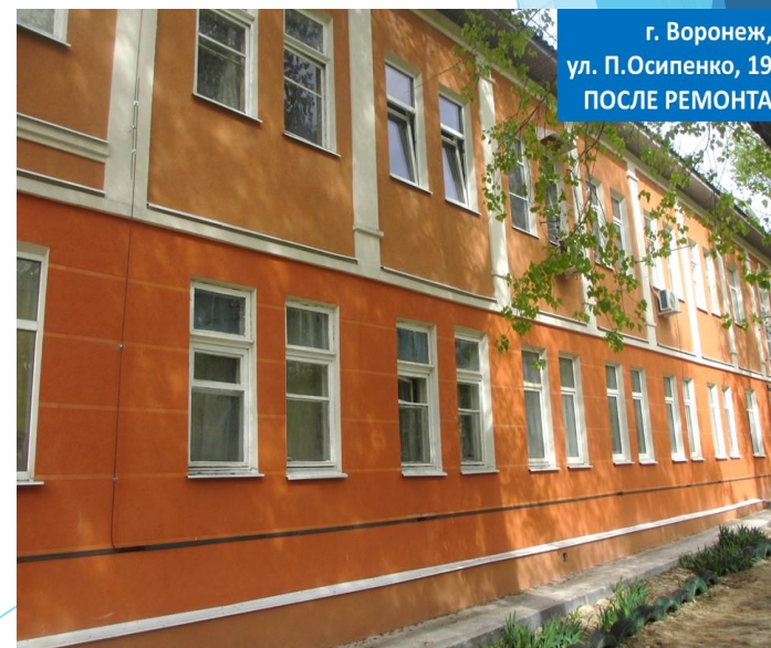
г. Воронеж, ул. П.Осипенко, 19 ПОСЛЕ РЕМОНТА