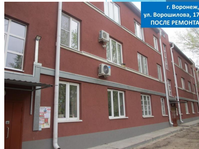
г. Воронеж, ул. Ворошилова, 17 ПОСЛЕ РЕМОНТА